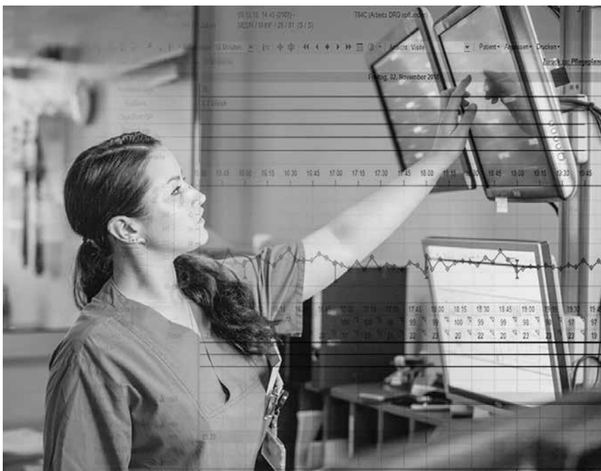
(2) Ein moderner Arbeitsplatz in der Klinik für Infektiologie. Durch die digitale Patient*innenakte hat das behandelnde Ärzt*innenteam den besten Überblick über den Gesundheitsstatus der*s Patient*in.

Ein Schwerpunkt der Klinik für Infektiologie liegt in der Erforschung, Prävention, Diagnostik und Therapie von Infektionskrankheiten bei Patient*innen mit Immunschwäche. Aufgrund stetig verbesserter Behandlungsmethoden und steigender Lebenserwartung nimmt die Anzahl dieser Patient*innen, die aufgrund eines geschwächten Immunsystems durch Infektionskrankheiten besonders gefährdet sind, kontinuierlich zu. Einen weiteren Schwerpunkt stellt die Behandlung von komplexen und schwer zu therapierenden infektiologischen Erkrankungen dar. Ein besonderer Fokus liegt zudem in der Behandlung von Patient*innen mit Infektionen vor und nach Organtransplantation sowie von HIV- und AIDS-Patient*innen. Dadurch übernimmt die Klinik für